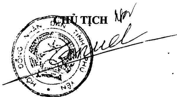
Huỳnh Tấn Việt

b) Hỗ trợ đầu tư cơ sở hạ tầng: Ngân sách tỉnh 80% và ngân sách huyện 20%/.